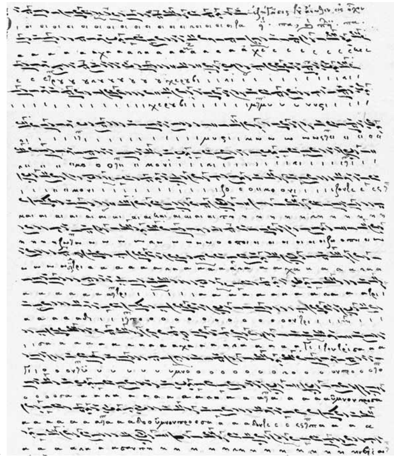
Αυτόγραφο Χουρμουζίου Χαρτοφύλακος. Έτος 1837. Παλαιό μέλος